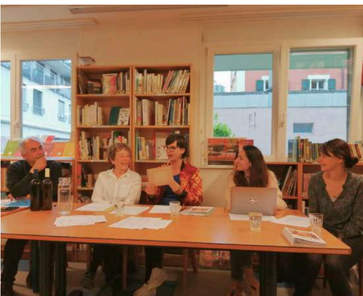
Le Comité lors de l'AG du 8 mai 2025