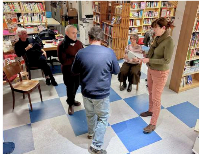
Lecture de L'Odyssée