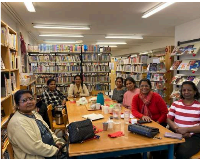
Tamils Makalirs Avaiyam